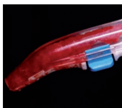
Obtención de hueso autólogo mediante Safescraper.